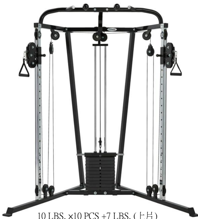
10 LBS. x10 PCS +7 LBS. (上片)