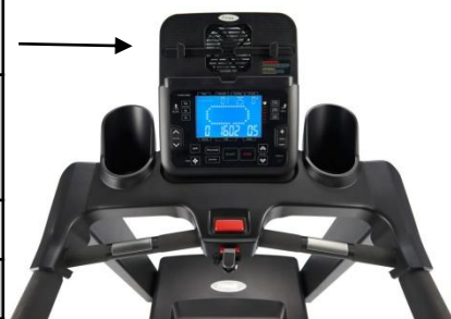
7.5 吋 LCD 顯示屏，配備 LED 背光