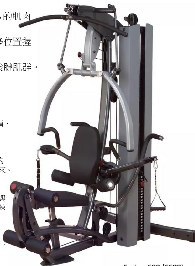
Fusion 600 (F600)

總尺寸：寬48" x 長99" x 高83"透過直接連接至 FUSION 600 背面，節省空間。進行抬膝、舉腿、扭轉及雙槓訓練，強化核心與上半身肌群。